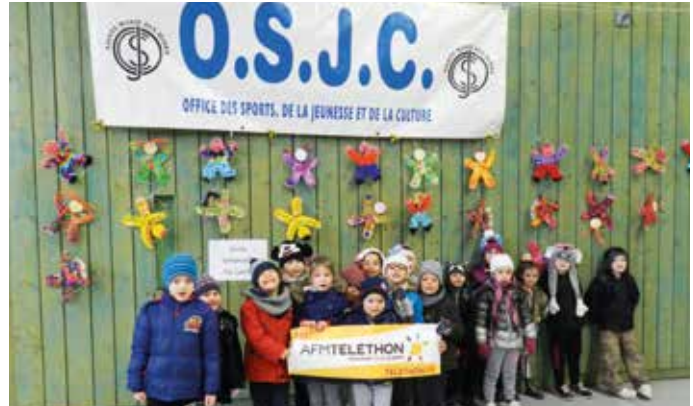
Créations élèves école maternelle de Lattre de Tassigny