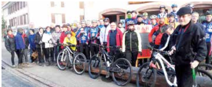
Départ balade Club Vosgien, Vélo Club et Groupe Cyclo