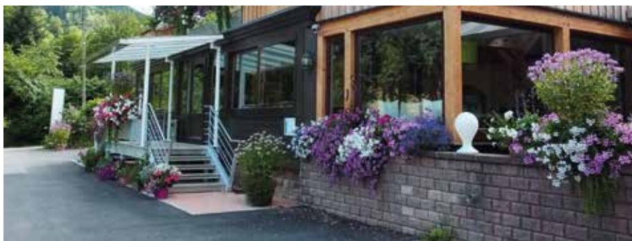
L'hôtel des Bagenelles

J'incite et invite les habitants à participer plus nombreux à l'édition 2017 et je souligne que lors de la journée des Fleurs (mi-mai) toute l'équipe des jardiniers de la ville est à votre disposition pour un rempotage gratuit.