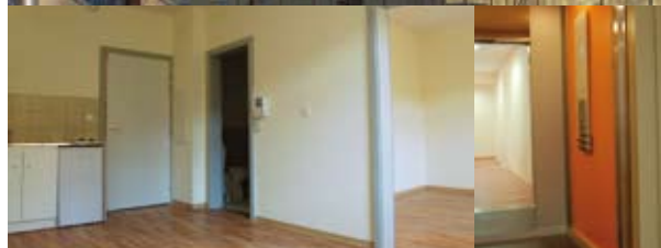
Photo du bâtiment, d'un appartement et de l'ascenseur

aujourd'hui se sont les résidents qui apportent les plus belles preuves de cette réussite « On se sent chez nous ! » ou encore « il n'y a rien à redire, c'est vraiment bien ici... » des témoignages simples et éloquentes ! Avec plus de 50 % d'occupation, quelques mois après son ouverture, la Nichée offre à la location encore 5 ou 6 appartements F2 de 35m 2 à 60m 2 . Renseignements Tél : 03 89 73 94 03 - 06 87 59 38 77