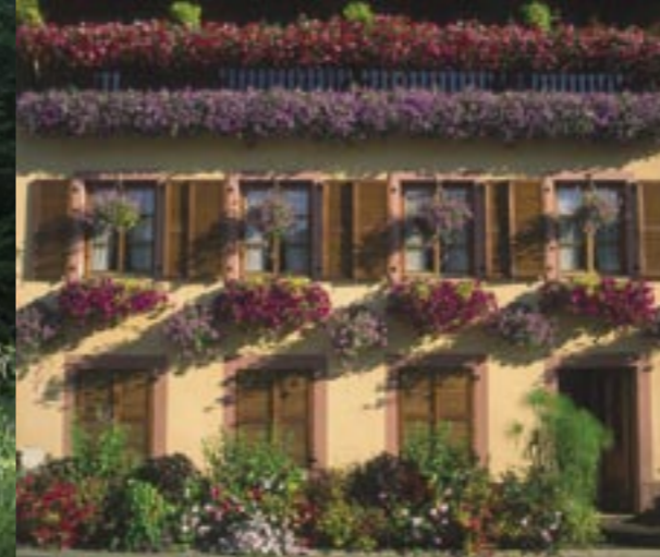
Un exemple de maison colorée et fleurie.