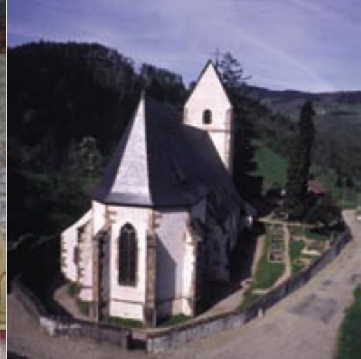
Située sur les hauteurs de Ste-Marie-aux-Mines, l'église de St-Pierre-sur-l'Hâte accueille chaque été des concerts de musique classique, éclairés à la chandelle.