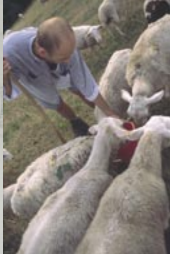
Les exploitants agricoles locaux favorisent l'accueil des touristes à la ferme et leur proposent des produits de qualité.