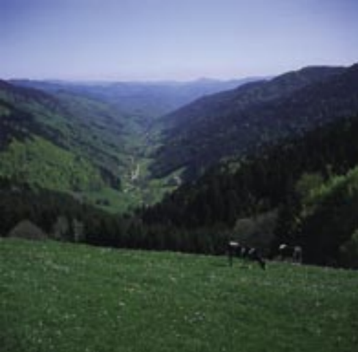
On accède aux zones habitées jusque dans le fond des nombreux vallons.

Lié depuis le Moyen Age à une activité humaine, le paysage du Val d'Argent reste marqué par sa situation géographique.