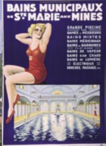
Affiche publicitaire pour les bains de Ste-Marie-aux-Mines. L'image représente la piscine telle qu'elle était aménagée à l'origine : cabines en bordure de bassin, vitrail et frise en émail.