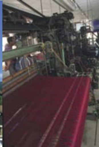
Métier à tisser mécanique en exposition à la Maison de Pays. Ces métiers remplacèrent progressivement les métiers à bras en usage jusque dans les années 1930.