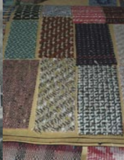
Échantillon de tissu ou article de Ste-Marie. Cette dénomination désigne également les jacquards ou les écossais qui ont fait la renommée des industries textiles locales au XIX e et au XX e siècles.