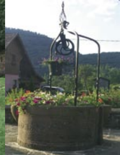
Le petit patrimoine est fort présent sur le territoire. Un ancien puits datant de 1690, situé à Echery.