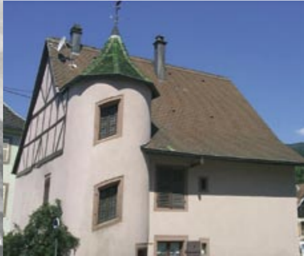
Maison à tourelle typique de l'époque minière. Ces maisons servaient de demeure aux cadres de l'administration minière. L'escalier hors œuvre est ici le signe d'une riche habitation.