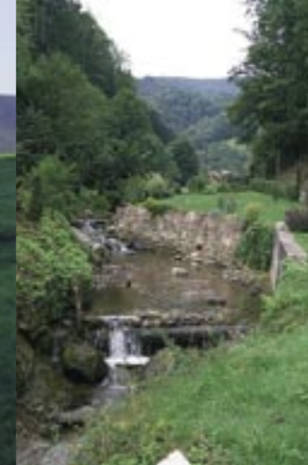
La Lièpvrette parcourt le Val d'Argent sur plus de 25 km. Plus d'une vingtaine de ruisseaux viennent l'alimenter.