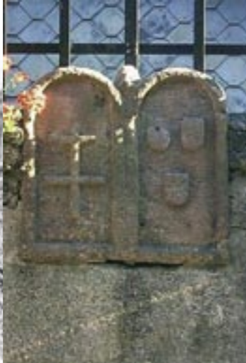
Borne frontière sur le pont de la Rue de la Vieille Poste à Ste-Marie-aux-Mines. A gauche, la croix à double branche représente les armoiries du Duc de Lorraine et à droite figurent celles des Ribeaupierres.