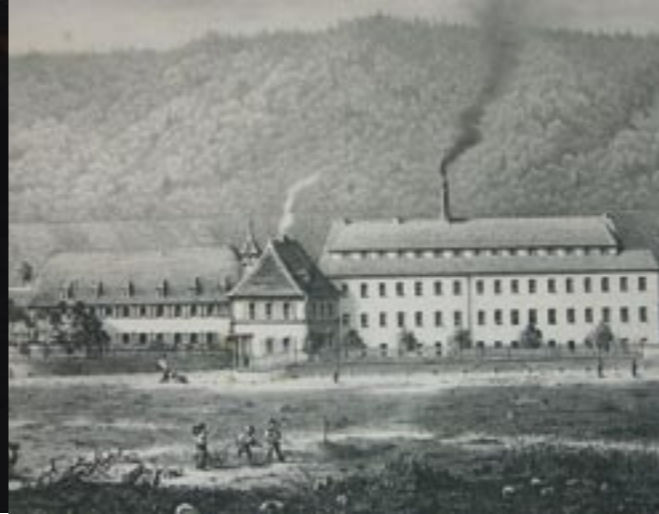
Filature Weisgerber, vers 1850. Le bâtiment à trois étages sur la droite accueillait les unités de production textile. Cette architecture des usines-blocs était fréquente à l'époque.