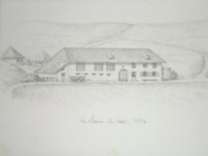
Ferme de la Chaume de Lusse en 1850, sur les hauteurs de Ste-Croix-aux-Mines. Son architecture est typique d'une ferme vosgienne avec sa porte cochère.

Fier de son passé minier et textile, le Val d'Argent accueille chaque année de grandes manifestations en lien avec ces patrimoines. En juin, la Bourse aux Minéraux, la plus importante d'Europe, vous permet de flâner au coeur des milliers de roches et de minéralisations. En septembre, le Val d'Argent célèbre les Amish lors du Carrefour Européen du Patchwork, créé en 1994. Patch et créations en tissus sont visibles dans les lieux d'exposition insolites de la vallée comme les églises.