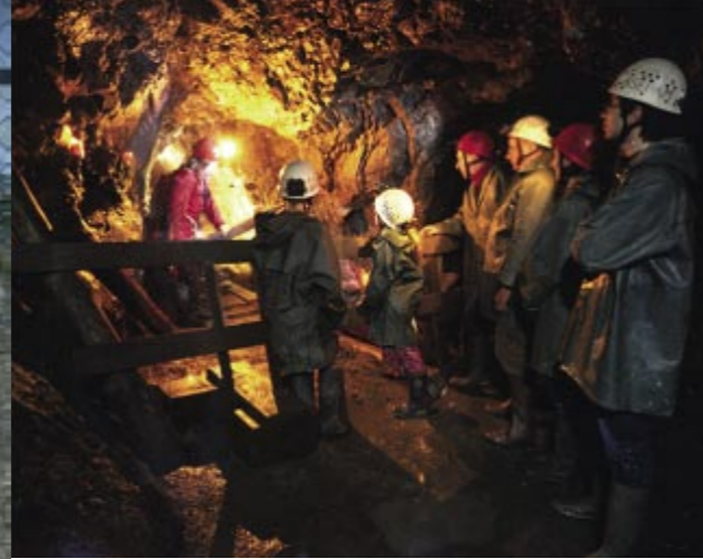
Salle du puits de la mine St-Louis Eisenthür. Creusée au XVI e siècle, elle se visite encore à l'heure actuelle et permet de découvrir les techniques minières d'antan.