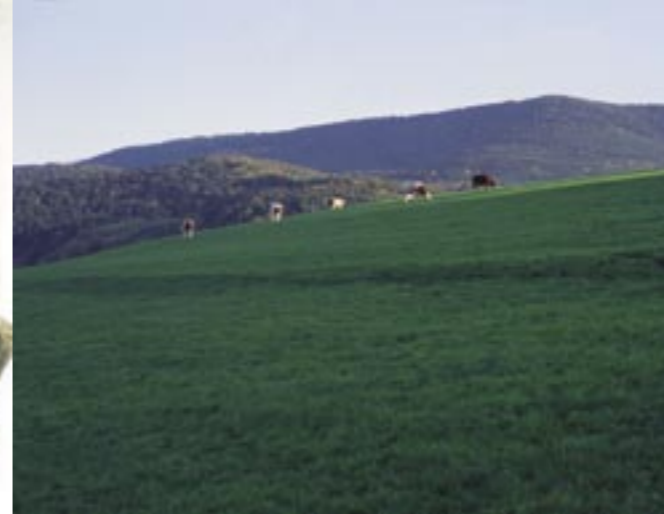
Sur les chaumes et dans les prairies, l'élevage bovin ou ovin se perpétue.