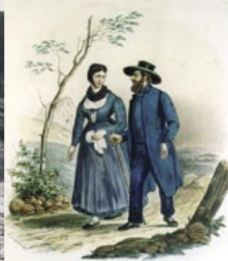
Originaires de Suisse, les anabaptistes arrivent dans le Val d'Argent au XVII e siècle. Ils ont introduit de nouvelles techniques favorisant la productivité de l'agriculture locale.