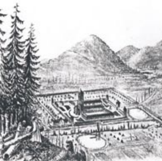
Gravure représentant le prieuré de Lièpvre au XVI e siècle. Construit au VIII e siècle par Fulrad, il fut détruit progressivement au XVIII e . Certaines pierres ont été réutilisées dans les constructions de Lièpvre.

De nos jours, le Val d'Argent reste une vallée industrielle qui fournit des emplois à près de la moitié de la population active. Il s'appuie aussi sur la diversité de son économie pour s'ouvrir au tourisme et ainsi faire découvrir un patrimoine inattendu, témoin d'un riche passé.