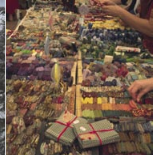
Lors des différentes manifestations en lien avec le tissu, plusieurs milliers de visiteurs sont accueillis chaque année.