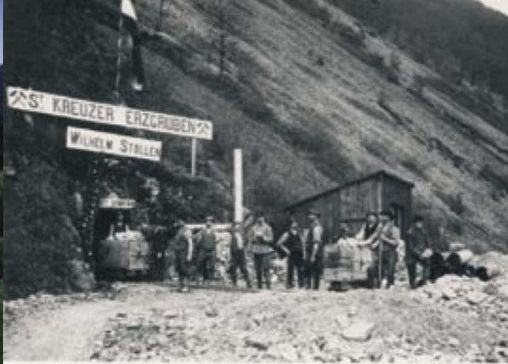
Entrée de la mine St-Guillaume à Ste-Croix-aux-Mines. Photographie de la fin du XIX e siècle. Les mineurs jetaient les gravats devant les entrées. Ces haldes sont encore visibles de nos jours.