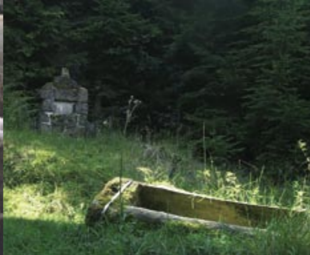
Un des nombreux calvaires que compte le pays, à Lièpvre.