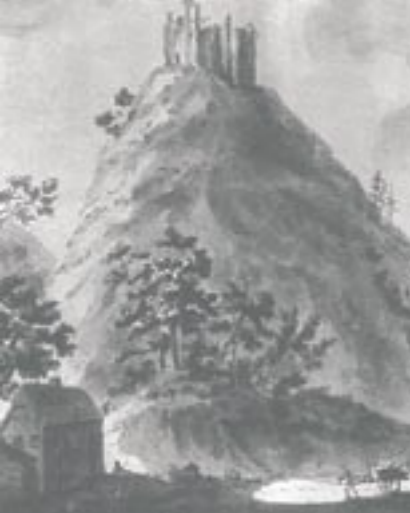
Le château d'Échery en 1785. Construit au XI e siècle, il protégeait le prieuré d'Échery. Il fut détruit durant la guerre de Trente Ans par les Suédois.

Des façades en pierres de taille aux maisons de maître, des bâtiments industriels aux nombreuses églises et chapelles, découvrez toute la diversité du patrimoine du Val d'Argent.