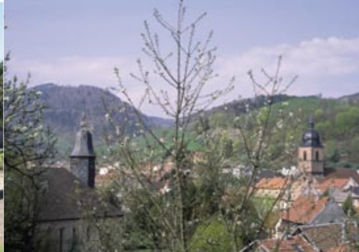
Dans le Val d'Argent, la tolérance religieuse date du XVI e siècle. Le temple réformé, à gauche, est situé dans l'ancienne Ste-Marie Alsace, protestante. Il côtoie l'église de la Madeleine (à droite) sise sur le territoire de l'ancienne Ste-Marie Lorraine, catholique.